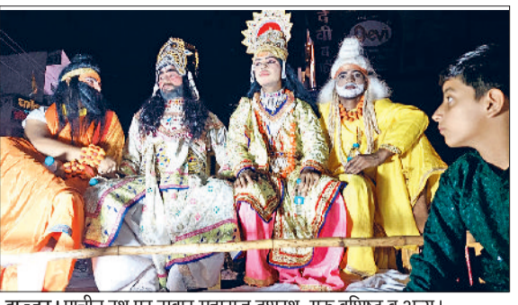
झज्जर। प्राचीन रथ पर सवार महाराज दशरथ, गुरु वशिष्ठ व अन्य।