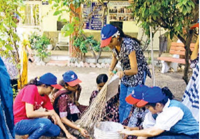
बहादुरगढ़। प्राचार्या की अगुवाई में श्रमदान करती छात्राएं।