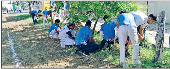
झज्जर। संस्थान परिसर में साफ-सफाई करते हुए स्वयंसेवक।