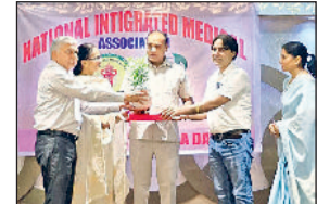
झज्जर। आयुर्वेद दिवस कार्यक्रम में अतिथियों को स्मृति स्वरूप पौधा भेंट करते हुए नीमा सदस्य।