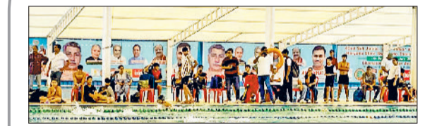
बहादुरगढ़। प्रतियोगिता में भाग लेते तैराक।