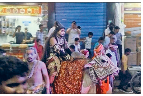
झज्जर। अघोरी बाबाओं के साथ नंदी पर सवार भगवान शंकर।

हरिभूमि न्यूज़ ▶▶ झज्जर जहां श्रीराम व सीताजी को एक रथ पर सवार दिखाया गया वहीं महाराज दशरथ, गुरु वशिष्ठ व अन्य साथियों के साथ प्राचीन रथ पर सवार होकर निकले। इसके अलावा श्रीराम कृष्ण, भगवान शंकर के अलावा लक्ष्मण, भरत, शत्रुघ्न आदि भी अलग-अलग रथों पर विराजमान दिखाई दिए। इस शोभायात्रा में अघोरी बाबाओं की झांकी आकर्षण का केंद्र रही। इस झांकी में जहां भगवान भोले नाथ शरीर पर भस्म लगाए नंदी पर सवार होकर चल रहे थे वहीं उनके आगे-आगे अघोरी बाबा अपनी मस्ती में नाचते हुए चल रहे थे। उन्होंने कई हैरतअंगेज करतब भी दिखाए।