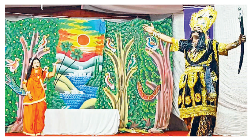
बहादुरगढ़। रामलीला के दौरान मंचन करते कलाकार।

मंचन के दौरान रावण का भगवान शिव द्वारा अहंकार मर्दन, नारद द्वारा भगवान विष्णु को श्राप, साधु-संतों द्वारा रावण को श्राप, राजा दशरथ द्वारा श्रवण कुमार को तीर मारना तथा श्रवण कुमार के माता-पिता द्वारा राजा दशरथ को श्राप देने जैसे प्रसंगों का जीवंत चित्रण किया