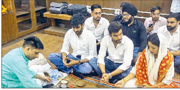
बहादुरगढ़। कार्यालय के शुभारंभ पर की जा रही हवन की तैयारी।