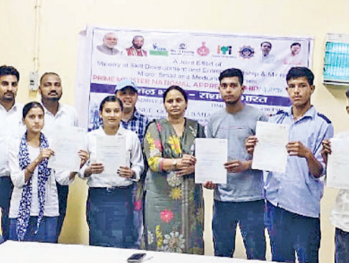
बहादुरगढ़। प्रिंसिपल के साथ नियुक्ति पत्र दिखाते चयनित विद्यार्थी।