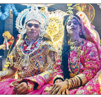
झज्जर। श्रीराम व सीता जी की झांकी।