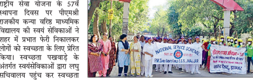
झज्जर। लघु सचिवालय के गेट पर उपस्थित शिक्षक, नगर परिषद कर्मचारी एवं स्वयंसेविकाएं।