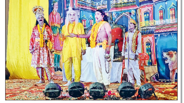
झज्जर। श्रीलोकेश रामलीला में मंचन के दौरान महाराज दशरथ से सहायता मांगते हुए पितृभक्त श्रवण।